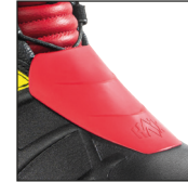
HAIX® 3Z Protector System