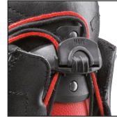
HAIX® FL Fit System