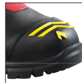
HAIX® High Durability Cap System